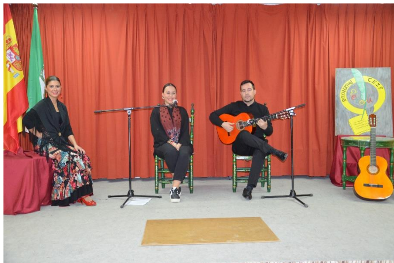
Día internacional del Flamenco