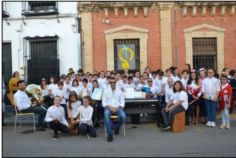
Salida Hdad. Rocío Los Palacios

Así pues consideramos que nuestro centro presenta un paisaje "musical" envidiable, donde las entradas y salidas, así como cambios de clase son marcados con música alusiva al momento del curso en que nos encontremos. Además entendemos que la música es el sello personal que mejor define a nuestro colegio, donde reine un ambiente muy sano y receptivo a cualquier nueva idea que surja entre el profesorado, lo que significa que dicho proyecto conlleva un éxito intrínseco de compromiso y trabajo por los profesionales y alumnado implicados.