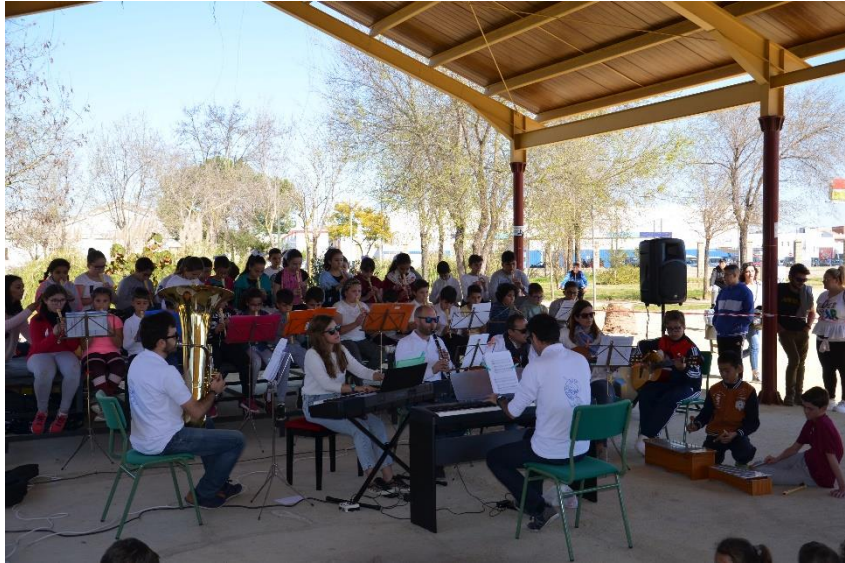
Día de Andalucía