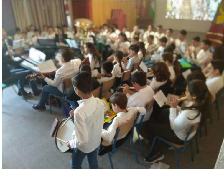
Concierto de Marchas de Semana Santa