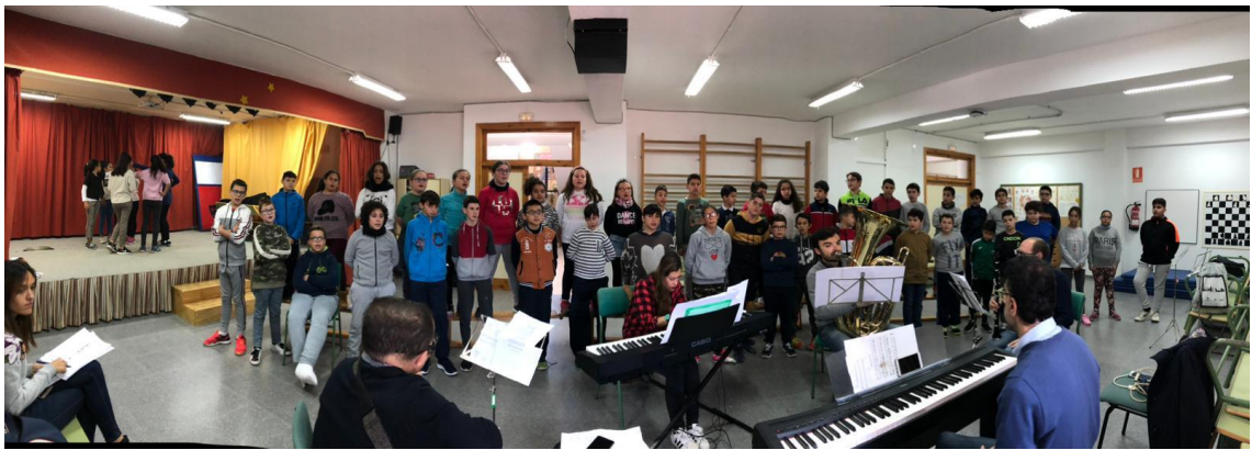
Ensayo Grupo Instrumental