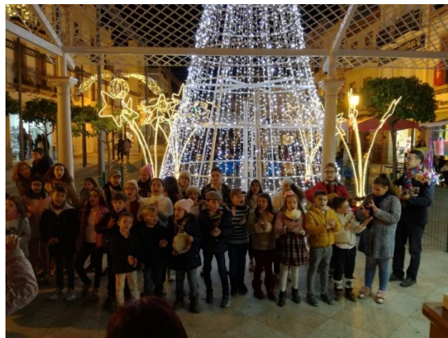
Coro de Campanilleros