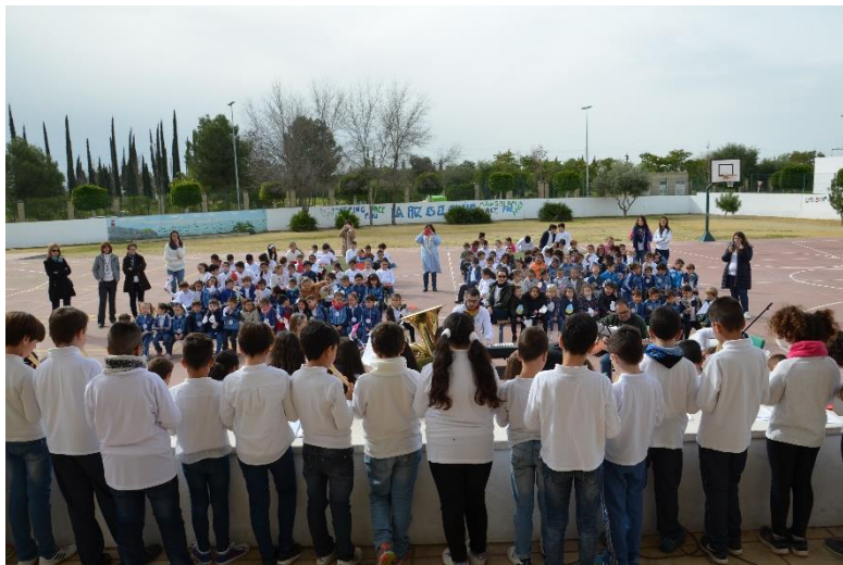
Celebración del Día de la Paz